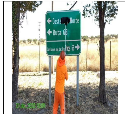
Mantenimiento y conservación de señales verticales