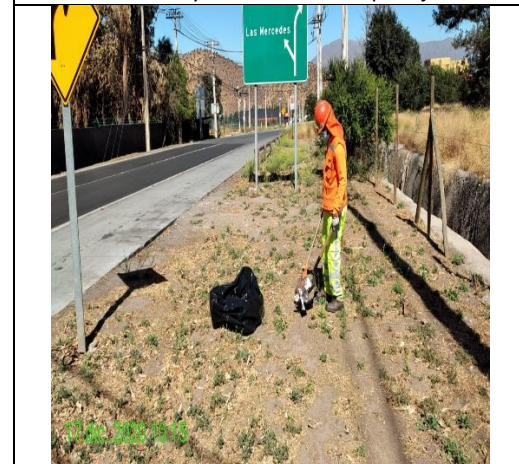
Mantenimiento y conservación de paisajismo