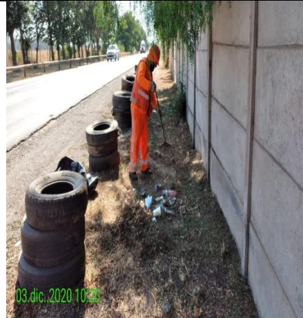
Mantenimiento y conservación de paisajismo