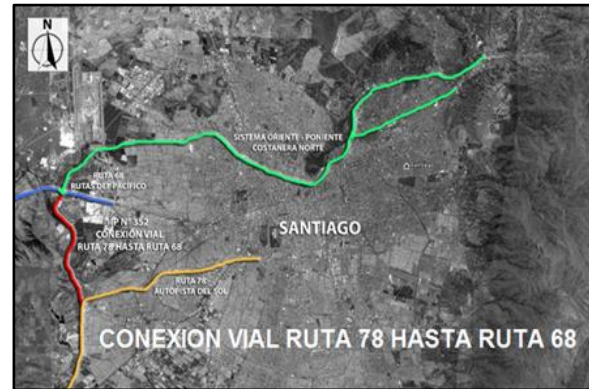
En rojo, emplazamiento en Región Metropolitana

El proyecto se encuentra emplazado en el sector Poniente de Santiago, entre las Comunas de Pudahuel y Maipú, próximo al río Mapocho, entre el Enlace del “Sistema Oriente – Poniente” con la “Interconexión Vial Santiago – Valparaíso – Viña del Mar” por el norte, y el empalme con la “Autopista Santiago – San Antonio, Ruta 78” por el sur.